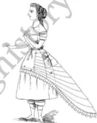
La demi-crinoline, 1867

Il famoso "couturier" britannico, sarto dapprima della Principessa di Metternich, ed in seguito anche dell'Imperatrice Eugenia di Francia, moglie di Napoleone III, decise di ridurre l'ampiezza della crinolina creando la demi-crinoline (1867-1872) che era caratterizzata dall'essere piatta sulla parte anteriore e gonfia sul posteriore arrivando fino a terra imitando una coda di pavone.