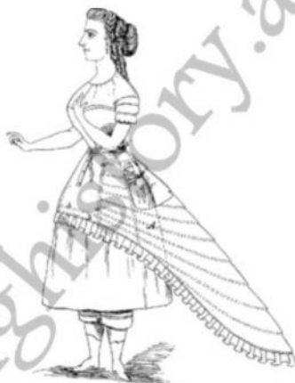
La demi-crinoline, 1867

El polsón es una prenda femenina que hacia finales del siglo XIX transforma la silueta femenina, que pasa de la típica forma de campana de la crinolina a la forma de cola, poniendo fin definitivamente a la moda de crinolina, que el propio creador Charles Frederick Worth (que hacia 1860 aligera este tipo de miriñaques sustituyendo las crines por aros metálicos y muelles más ligeros), la considera excesiva en sus dimensiones que han ido creciendo hasta desnaturalizar por completo la silueta femenina. El famoso costurero británico, primer sastre de la Princesa de Metternich y también de la Emperatriz Eugenia de Montijo, mujer de Napoleón III, decide reducir la amplitud de la crinolina creando la crinolina elíptica (1867-1872) que se caracterizaba por ser plana en su parte delantera y más abultada hacia atrás como una cola de un pavo real.